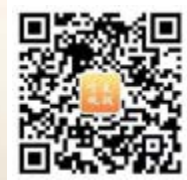
宁夏统战微信公众号