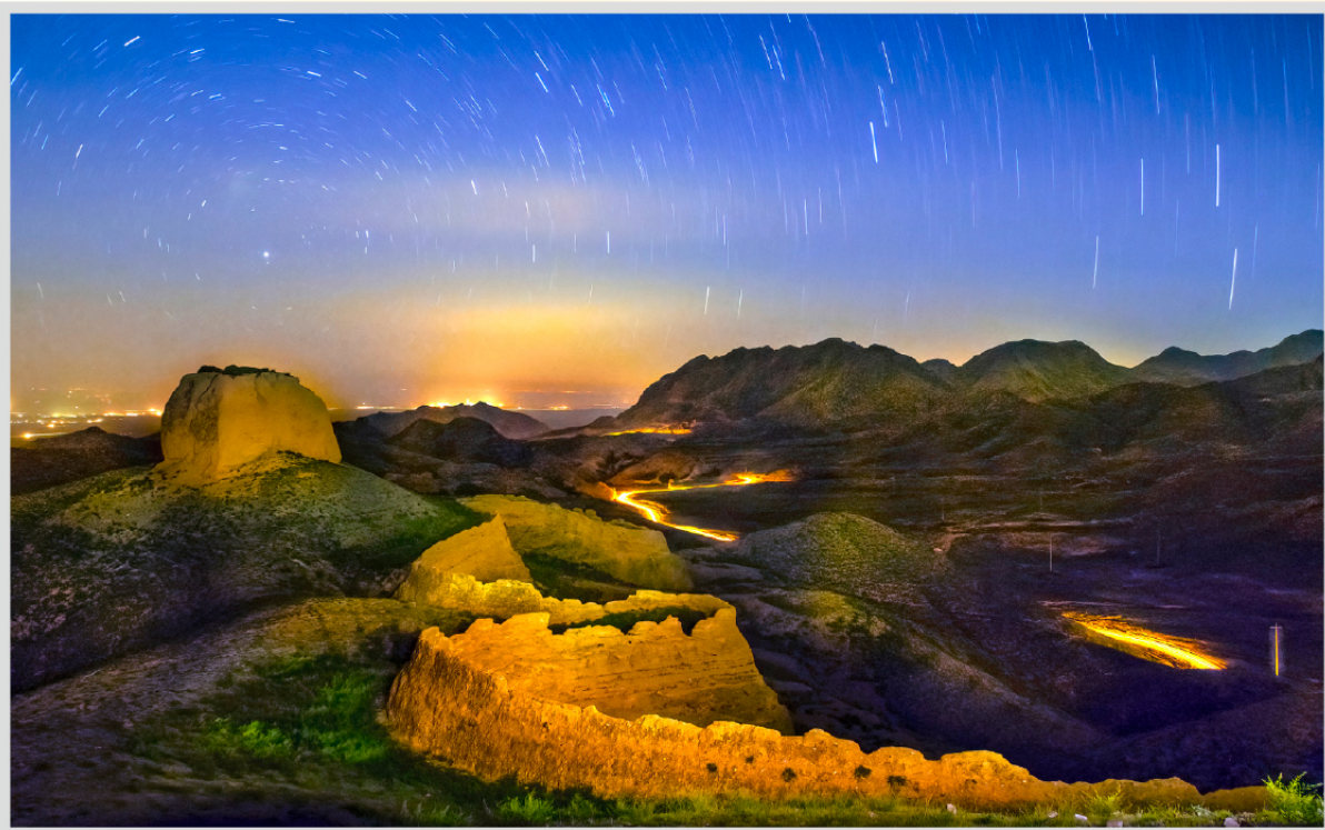
王建波摄影作品《夜》-2