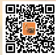
民进中央微信公众号