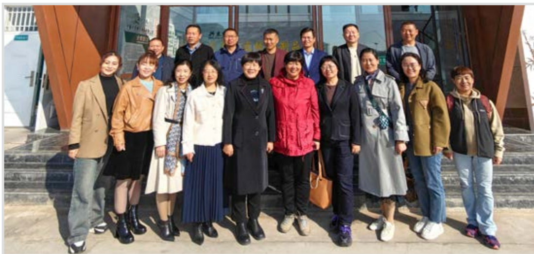
民进青铜峡市委会联合民进宁夏区直联合三支部、民进北方民族大学支部举办了“凝心铸魂强根基、团结奋进新征程”主题教育系列活动