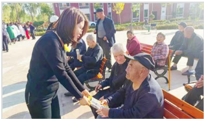
民进中宁鸣沙支部开展敬老院慰问活动

信息28条，采用11条。围绕土地流转开展深入调研，形成《关于规范土地流转、保障各方权益的建议》提交民进中宁县委会。此外，立足民进特色和优势倾情组织社会服务活动。今年重阳节，支部联合民进中宁县委会，走进中宁县第一敬老