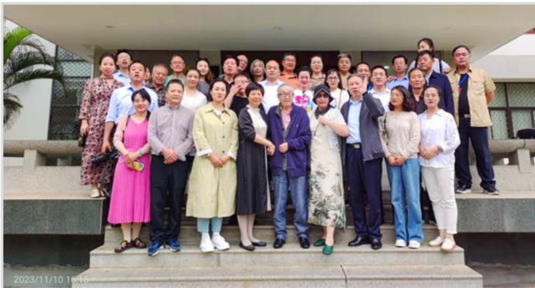
民进原州区支部参加原州区赴福州市三区“山海之源 艺游鼓楼、马尾、长乐”采风交流活动