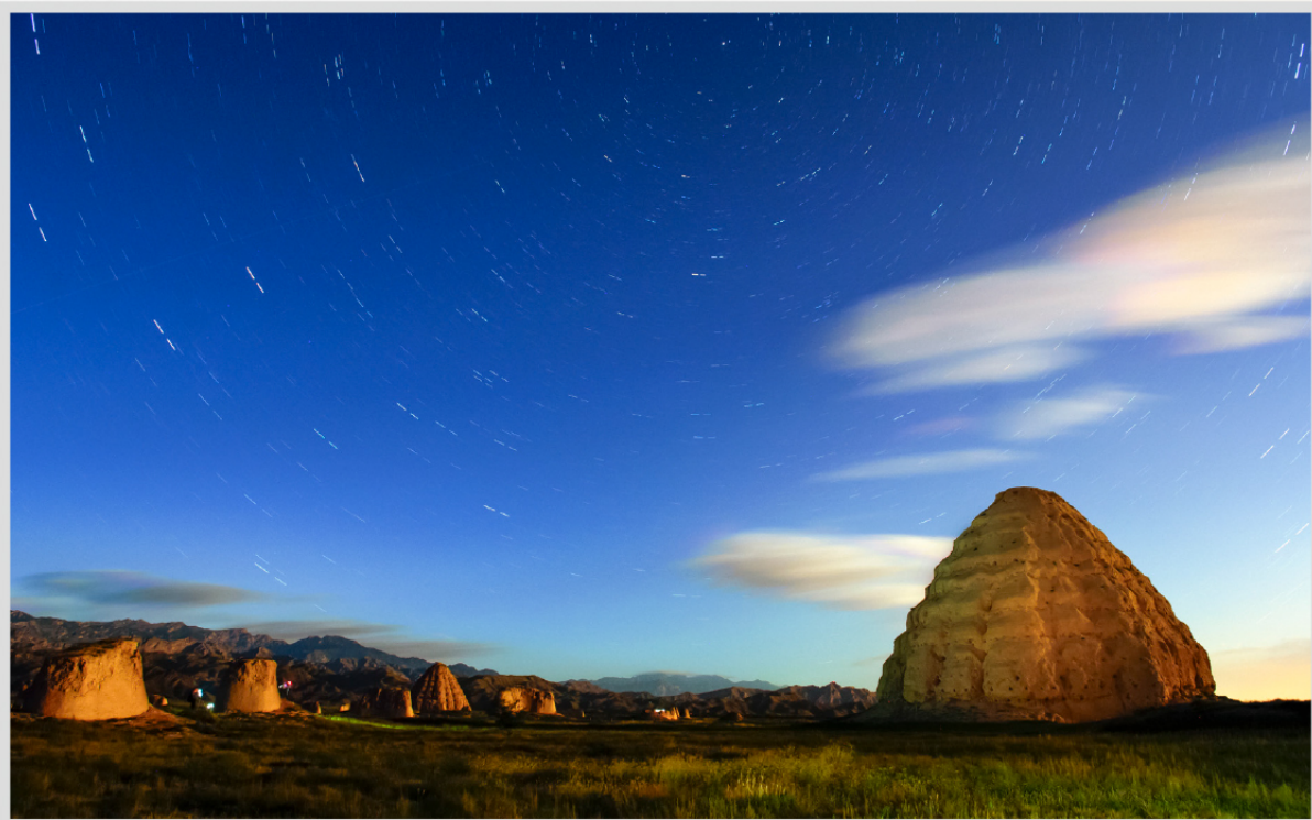
王建波摄影作品《夜》-1