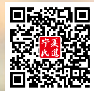
宁夏民进微信公众号