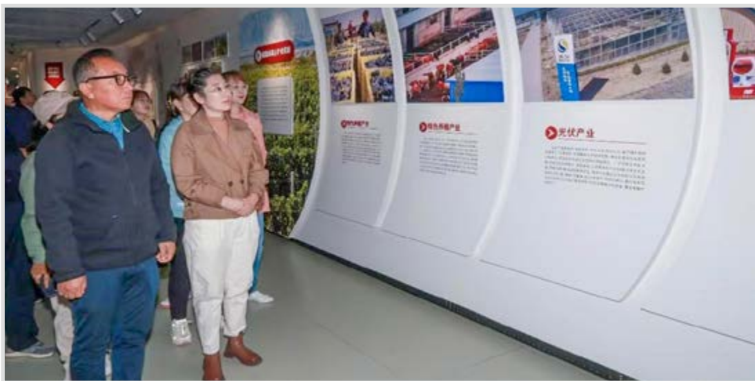
民进惠农总支组织会员在闽宁镇开展“沿着总书记足迹 感悟思想伟力”主题教育实践活动